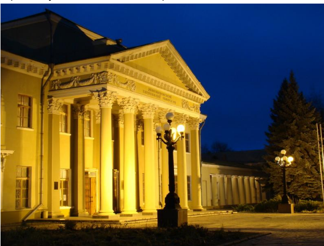
Палац студентів Дніпропетровського національного університету імені Олеся Гончара