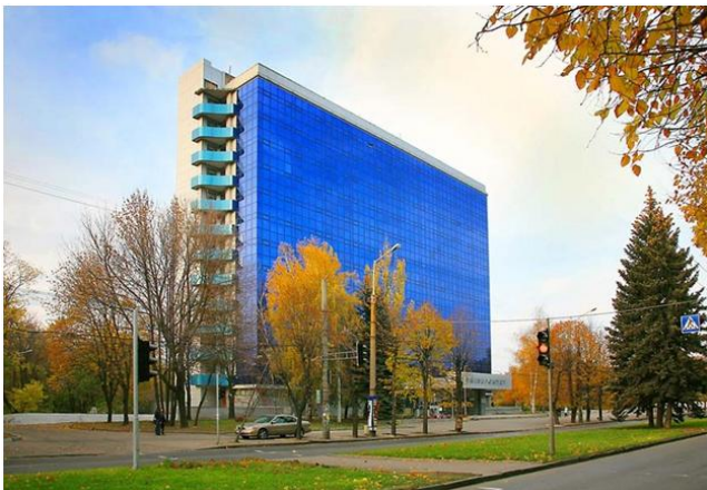
Корпус №1 Дніпропетровського національного університету імені Олеся Гончара

Конференція буде проводитись на базі Дніпропетровського національного університету імені Олеся Гончара